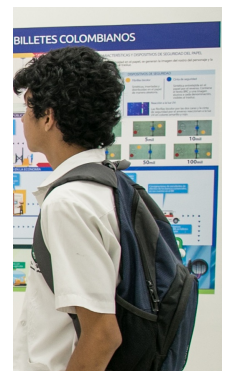
| SANTA MARTA |