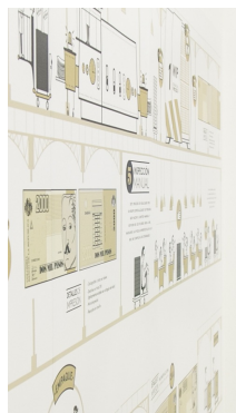
| MEDELLÍN |