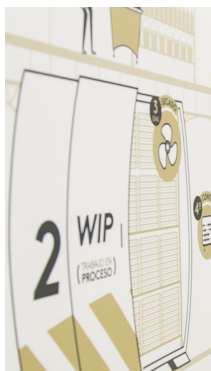
| CALI |