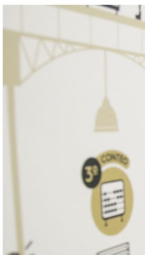
| BOGOTÁ |

¡Anímate a vivir esta experiencia única, elige la ciudad y planea la visita de tus estudiantes!